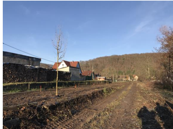
Plantations, gare d'Ottrott

Les études du mobilier sur mesure ainsi que des structures (belvédère, portes de la Léonardsau et les différentes passerelles) sont en cours de finalisation . La validation va se poursuivre prochainement par la phase de réalisation des prototypes.