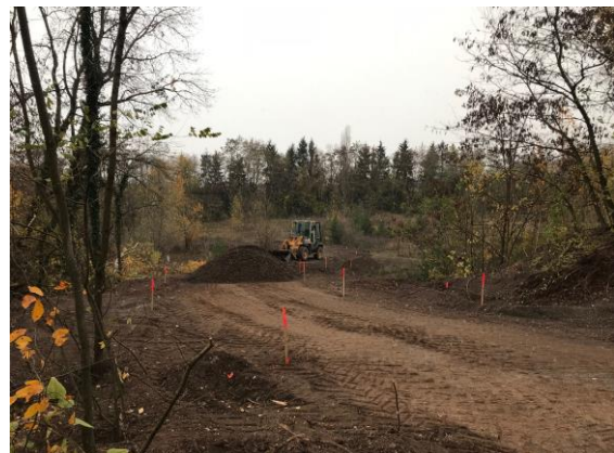
Nivellement de la voie