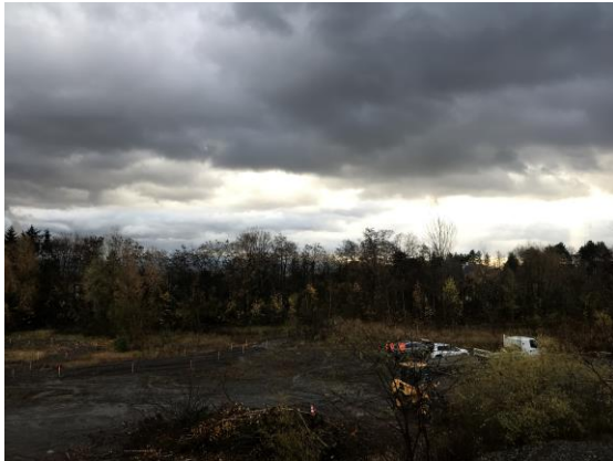
Préparation en contrebas des carrières

Les travaux de préparation ont également débuté en contrebas des carrières avec le criblage du porphyre. Les premières plantations ont, par ailleurs, été réalisées à la gare d'Ottrott.