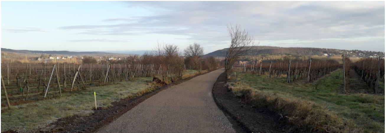
Etat actuel de la voie, à Ottrott (au 1 er janvier 2019)

Les travaux ont débuté fin novembre 2018 par l'élagage du linéaire de l'ancienne voie ferrée de manière à libérer l'emprise pour les véhicules de chantier.