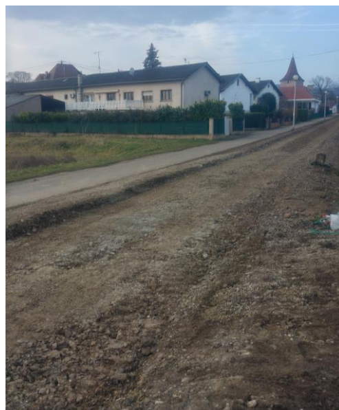
Voie verte, en arrivant Porte du Lion